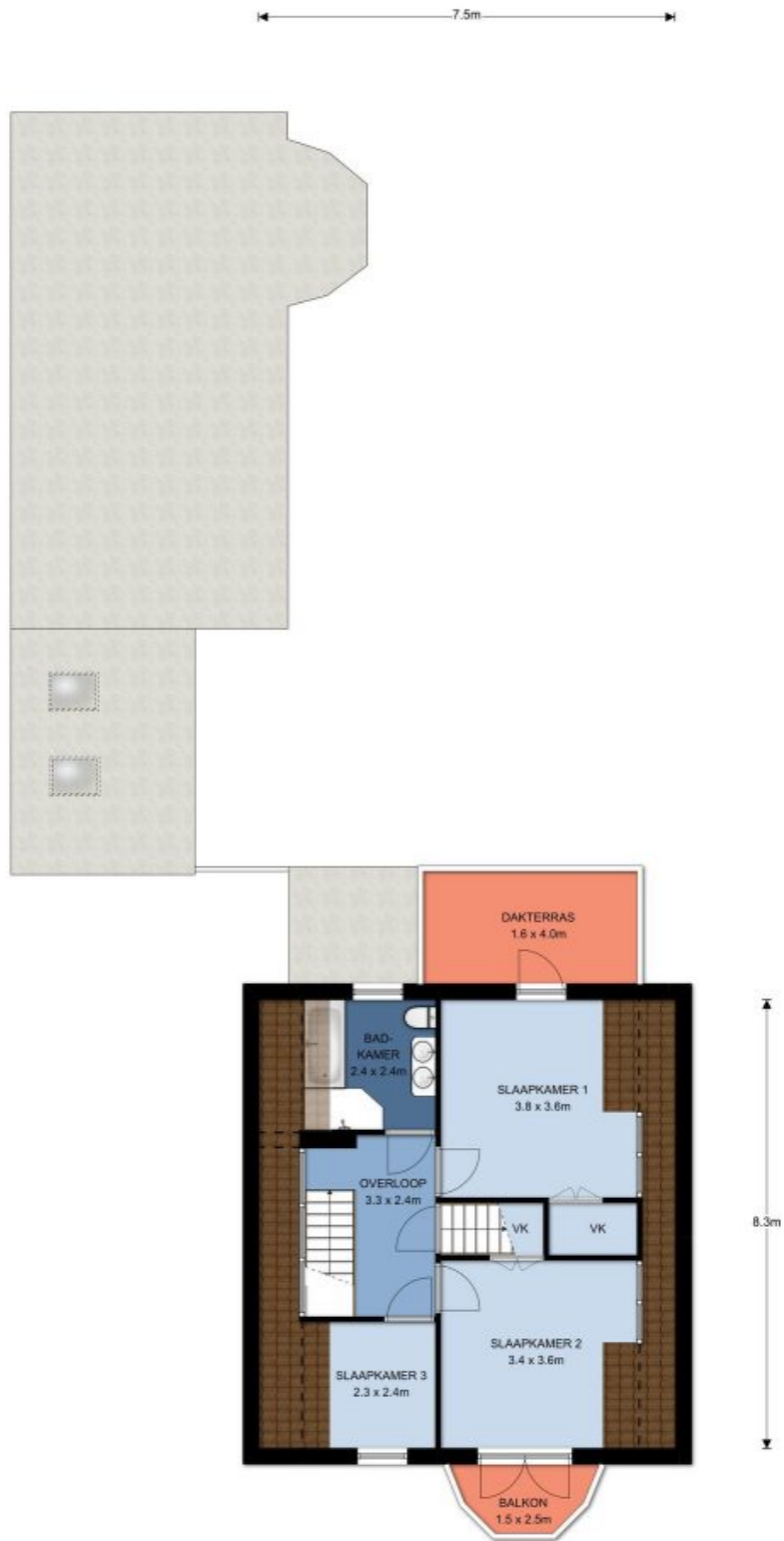
1e Verdieping, Jacob van Gaesbeeklaan 14 te Driebergen-Rijsenburg De plattegronden zijn geproduceerd voor promotionele doeleinden en ter indicatie. Aan de plattegronden kunnen geen rechten worden ontleend. © topr.nl